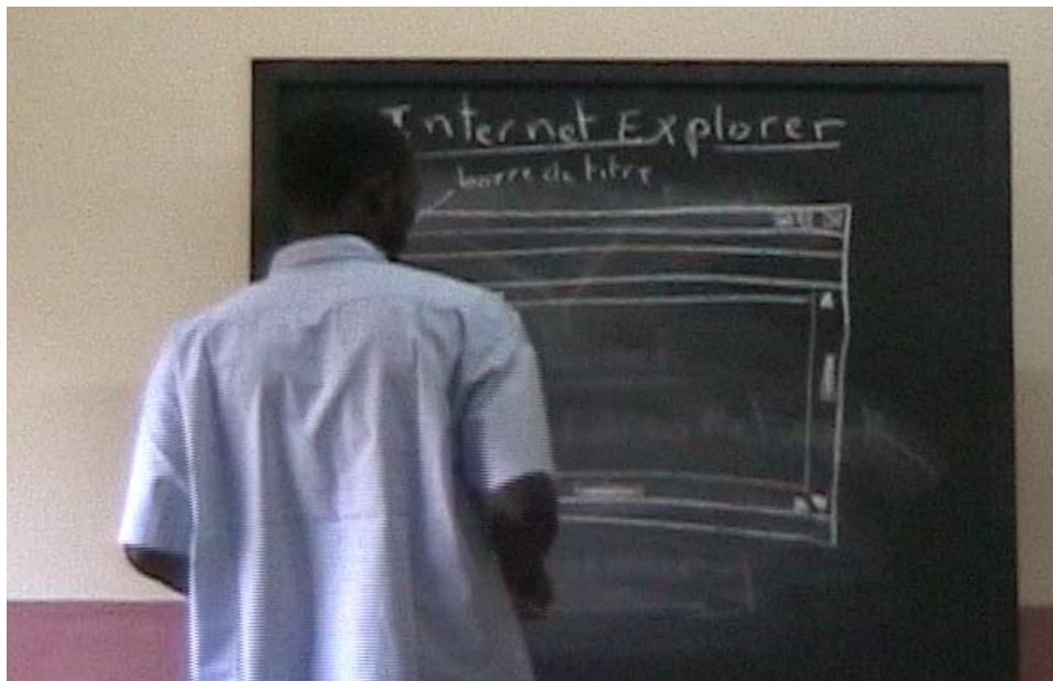
Figure 2 : Capture d'image d'une observation de classe vidéographiée.

[...] les parties de l'ordinateur [...] année 2 [...] le système Windows [...] année 3 [...] le logiciel de traitement de texte [...] année 4 [...] le logiciel Excel [...] année 5 [...] Internet Explorer [...] (extrait d'entretien, enseignant).